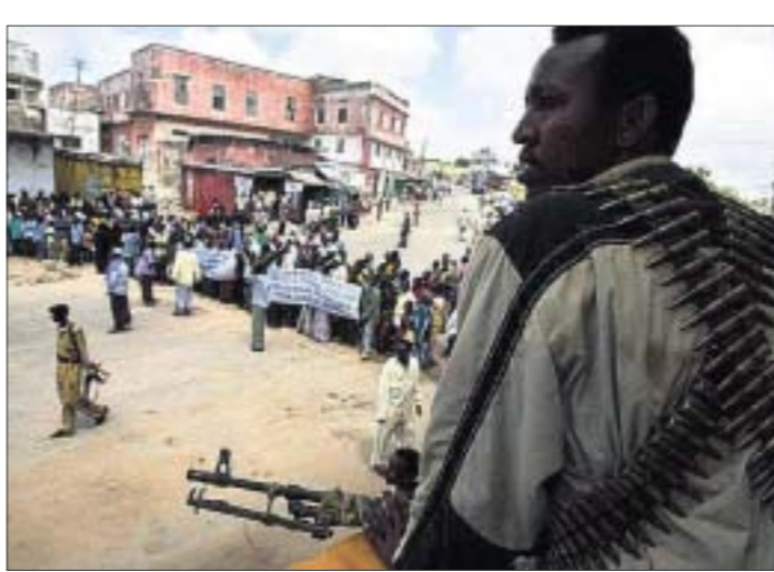
Somalien hallituksen joukkoihin kuuluva mies vartioi maan pääkaupungin Mogadishun katuja.

Somalissa ei ole ollut toimivaa keskushallitusta vuoden 1991 jälkeen. Tuolloin diktaattori Mohamed Siad Barre syöstiin vallasta. Maassa toimii nyt YK:n tunnustama väliaikahallitus, jota osa klanipäälliköistä on siirtynyt tukemaan.