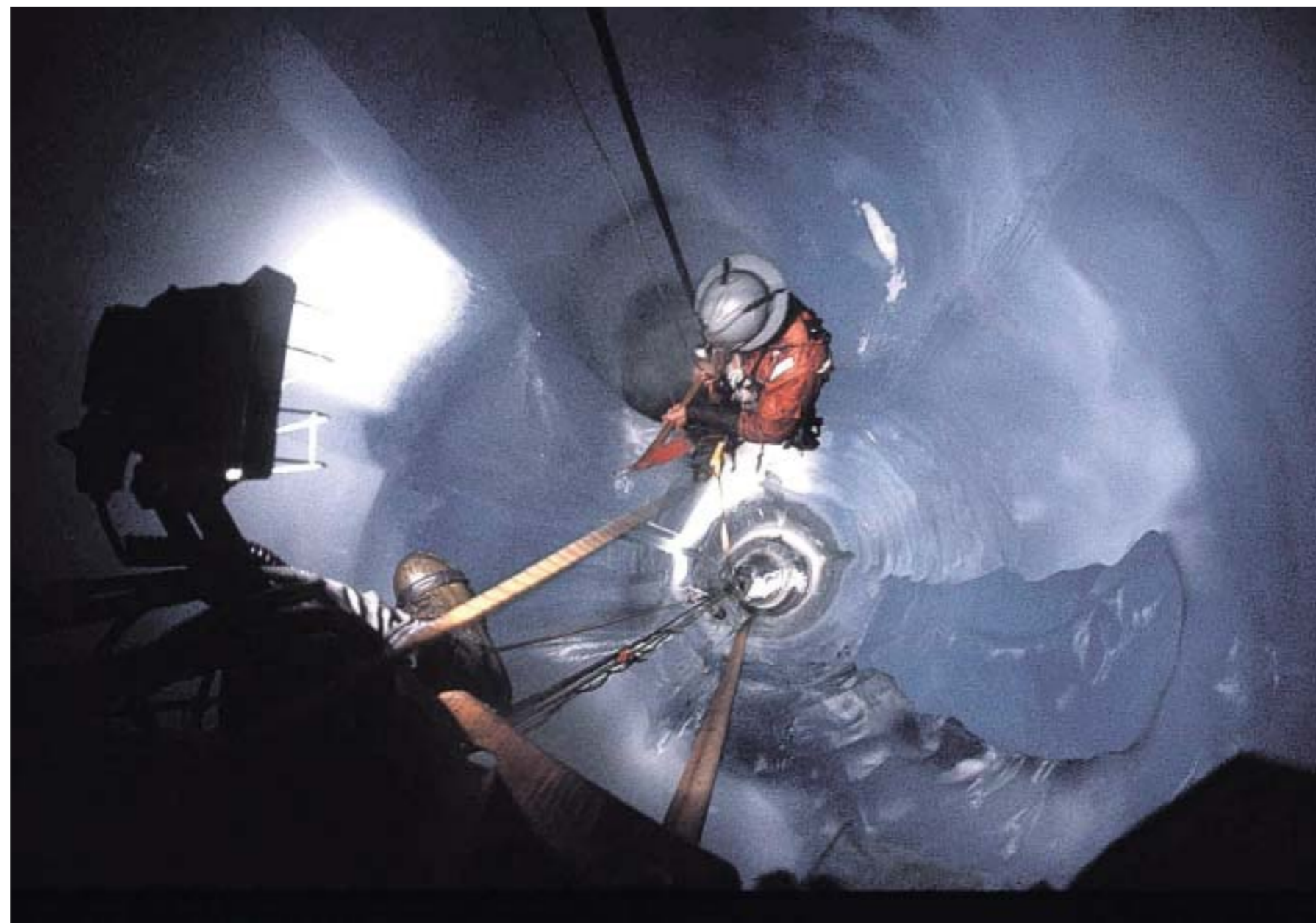
Yksi kuudesta amerikkalaisihävittäjästä nostettiin esiin jään sisällä jo vuonna 1992. Noin 80 metrin syvyinen jäätunneli tehtiin sulattamalla.

Kadonneet koneet paikallistettiin jäätikön sisällä ensimmäistä kertaa 1980-luvun alussa.