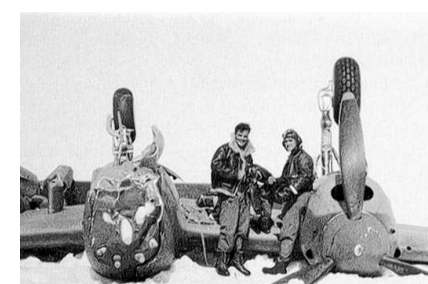
1942 mussten die amerikanischen Piloten auf Grönland notlanden.

Börsengang Novacapital und Worag wollen derweil den Kapitalmarkt für die Schatzsuche begeistern und bereiten die Ausgabe von Aktien vor. „Zunächst wird es noch in diesem Jahr ein nichtöffentliches Angebot für die Mitglieder des Vereins geben“, sagt Straub. Im Frühjahr 2009 ist dann ein öffentliches Angebot für alle interessierten Anleger geplant, der Börsengang in Frankfurt soll im Frühjahr 2010 folgen. Warum ein Börsengang? „Natürlich